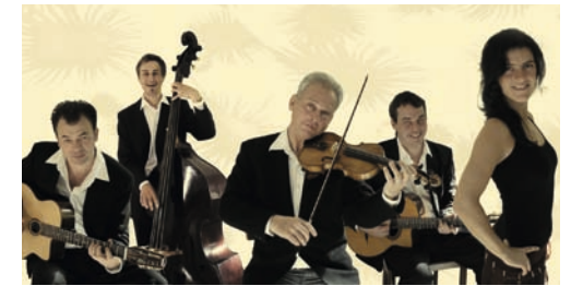
Hot Club Harmonists